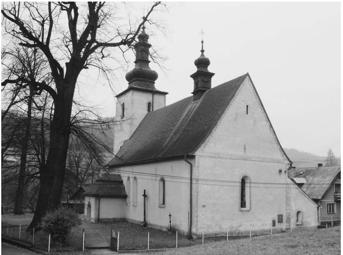
Fot. 2. Kostol sv. Jána Krstiteľa vo Veľkej Lesnej. St. John the Baptist church in Veľká Lesná.

V oblasti Zamaguria sa zachovali pamiatky predovšetkým sakrálneho charakteru dokumentujúce stavebnú činnosť od gotiky po súčasnosť. Staviteľské aktivity ovplyvňovali samozrejme páni, resp. majitelia jednotlivých obcí, pričom k najvýznamnejším v tejto oblasti patrili šľachtické rody Görgeyovci a Berzeviczyovci. Počas 13. a 14. storočia nastal rozvoj výstavby jednoduchých jednolodových dedinských kostolov, tak ako na území celého Slovenska. Na základe dejín osídlenia tejto oblasti je zrejmé, že kostoly stáli v stredoveku aj v tých obciach, kde sa dodnes nezachovali, prípadne prešli neskoršie prestavbou natoľko, že ich pôvodná hmota sa nezachytala. V každej oblasti sa vytvárali stavebné centrá okolo významných stavieb, najčastejšie pri stavbe kláštorných areálov.