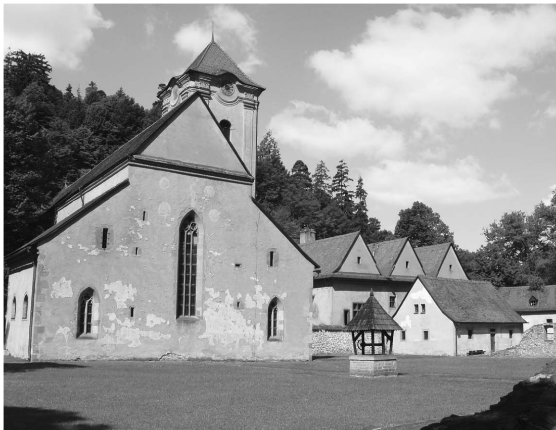
Fot. 5. Červený kláštor s kostolom sv. Antona pustovníka. The Red Monastery with the Church of St. Anton the Hermit.

kláštor svetskí vlastníci. Roku 1711 prichádzajú do kláštora kamalduli a kláštor prestavali v duchu baroka. Nanovo vystavali domy, z ktorých jeden stojí dodnes. Kamalduli sústredili pozornosť na rekonštrukciu kostola, ktorý získal bohatú štukovú výzdobu klenby, na jeho severnú stranu pristavali vežu a na záver sa vyhotovil aj nový mobiliár. Po zrušení kláštora Jozefom II. roku 1782 celý areál postupne chátral, jeho rekonštrukcia sa začala v 50-tych rokoch 20. storočia.