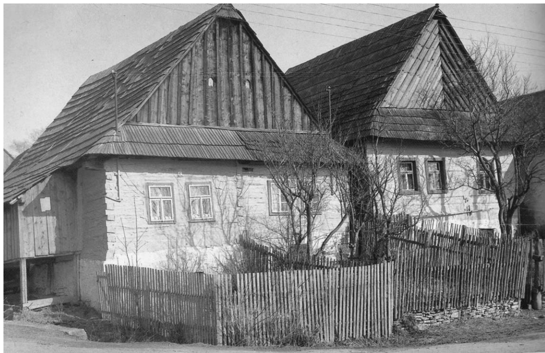
Fot. 6. Drevená ľudová architektúra. Wooden folk architecture.

do výbavy. Izbu osvetľovali drevenými horiacimi fakľami, kahancami, lampami a lampášmi.