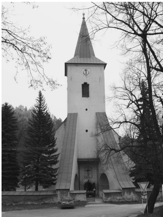
Fot. 3. Kostol Nanebovzatia Panny Márie v Spišskej Starej Vsi. The Church of the Assumption in Spišská Stará Ves.

Jedným z najstarších kostolov na Zamagurí je aj kostol Nanebovzatia Panny Márie v Spišskej Starej Vsi z 2. polovice 14. storočia. Jednoloďový kostol s polygonálnou svätyňou podopieraný oporné piliere nielen v časti svätyne, ale dva mohutné piliere s priechodmi spevňujú aj vežu. Svätyňa si zachovala pôvodnú rebrovú klenbu so svorníkmi s námetmi jeleňa a kvetmi. Loď má už krížovú klenbu zo 17. storočia. Zachovali sa aj vrcholnogotické okná, pričom každé má iné kružby, čo je dokladom schopností staviteľov. Rovnako sa