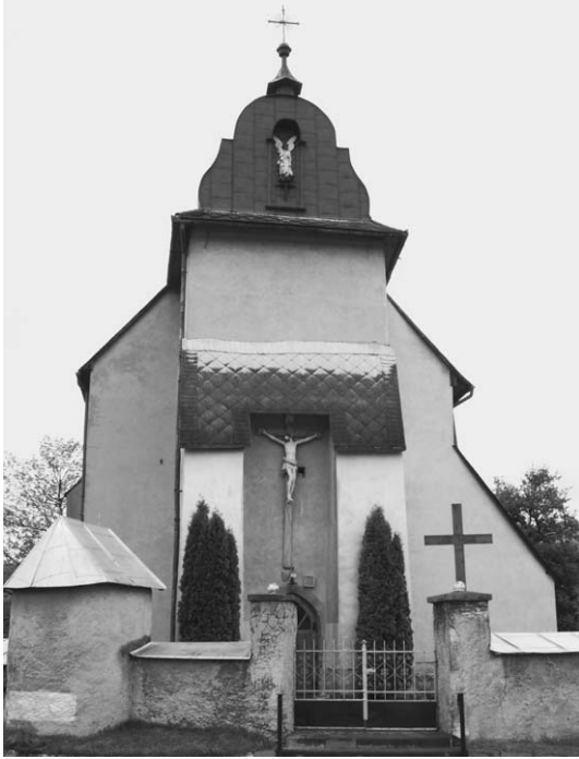
Fot. 4. Kostol sv. Petra a Pavla v Matiašovciach. The Sts. Peter and Paul's church in Matiašovce.