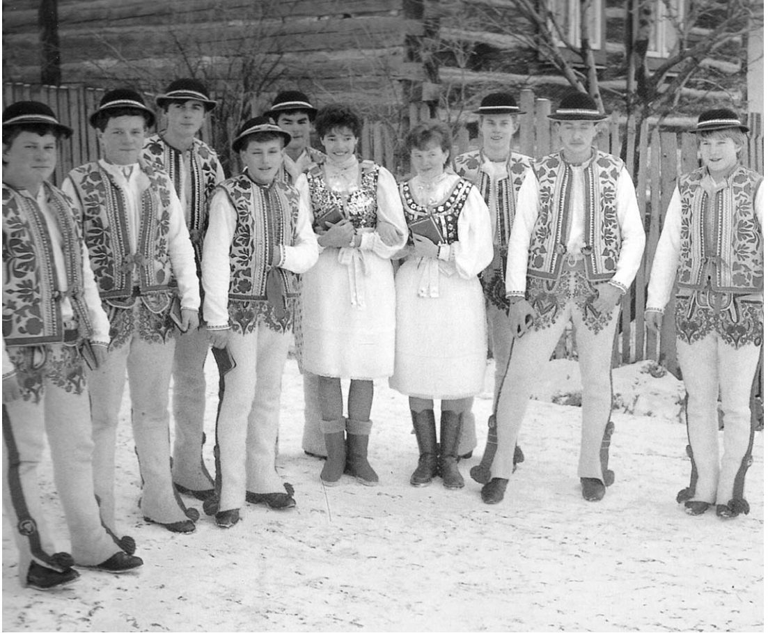
Fot. 7. Ľudový odev. Folk clothes.

Veľkom Lipníku). Rusadelné sviatky boli v znamení sviežej zelene ako symbolu leta, ktorou si ľudia až do súčasnosti ozdobujú svoje príbytky. Mládenci stavali dievčatám máje. Vyvrcholenie leta bolo spojené so sviatkom sv. Jána Krstiteľa a zvykmi pálenia jánskych ohňov – sobotki. Ján Krstiteľ svätzil vodu, po sviatku sa mohlo v potokoch kúpať.